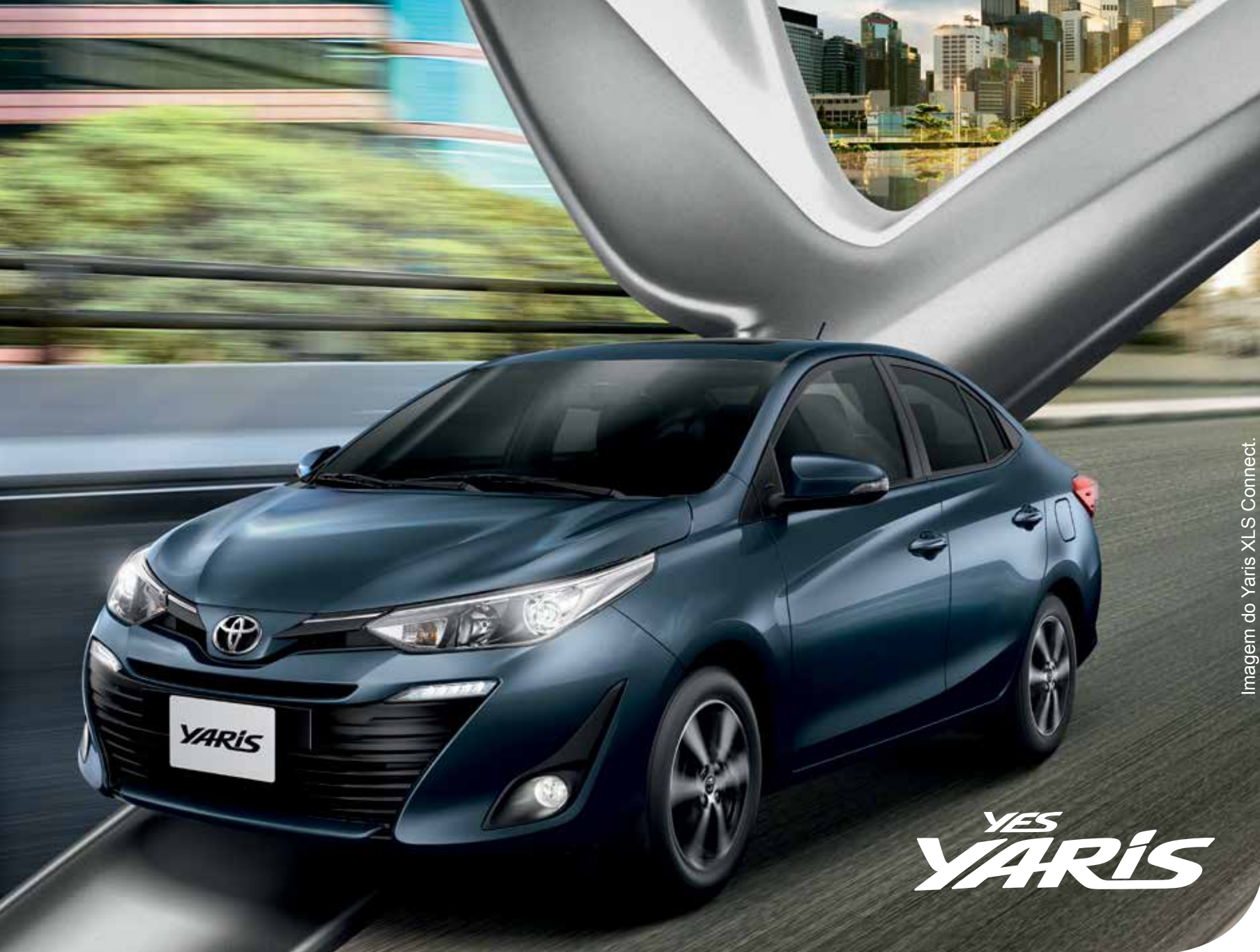
Imagem do Yaris XLS Connect.