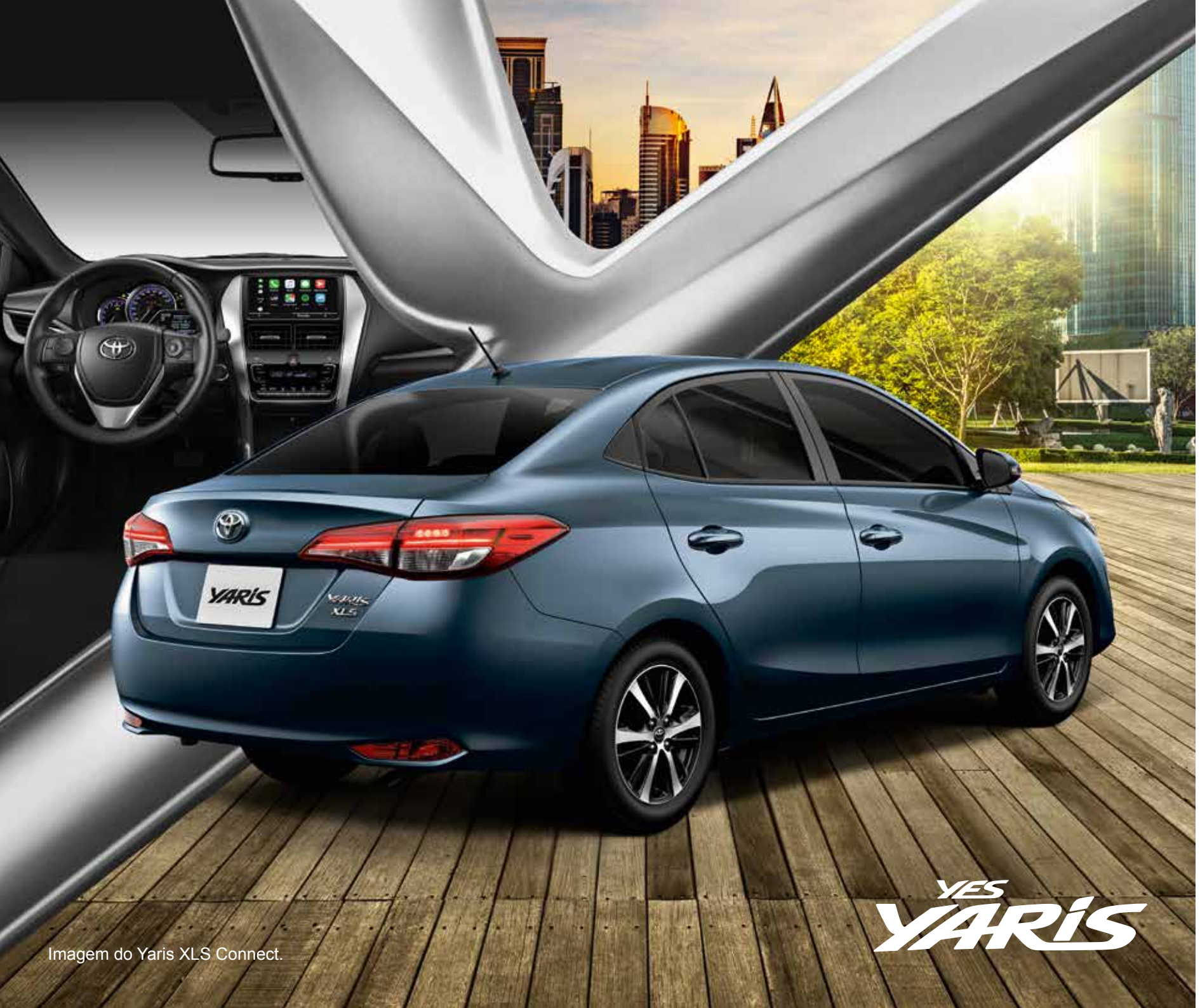
Imagem do Yaris XLS Connect.